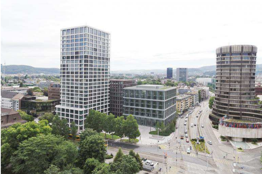
Roger Diener, Valerio Olgiati und Miller & Maranta haben drei Geschäftshäuser für Basel entworfen.

Im Basler Baloise-Park stehen Neubauten von Roger Diener, Valerio Olgiati sowie Miller & Maranta nebeneinander. Für sich können alle Objekte überzeugen. Doch ein Ensemble, das mehr ist als die Summe seiner Teile, ist leider nicht entstanden.