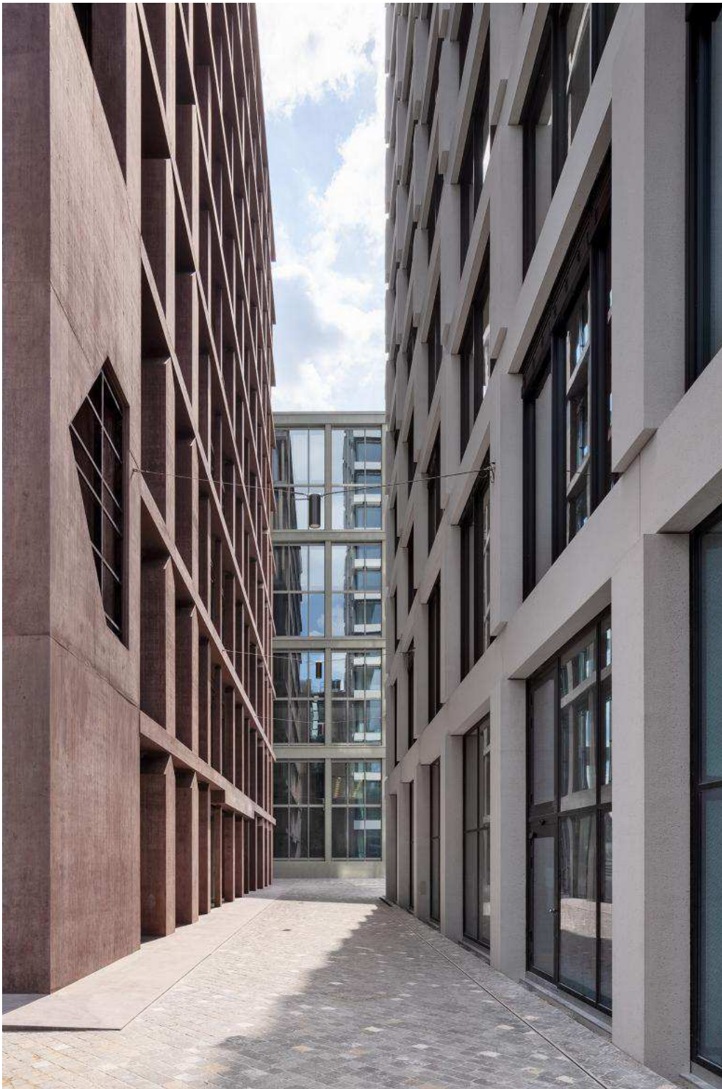
Blick auf den Bau von Roger Diener zwischen Valerio Olgiatis Geschäftshaus (links) und dem Hotel von Miller & Maranta (rechts) hindurch.