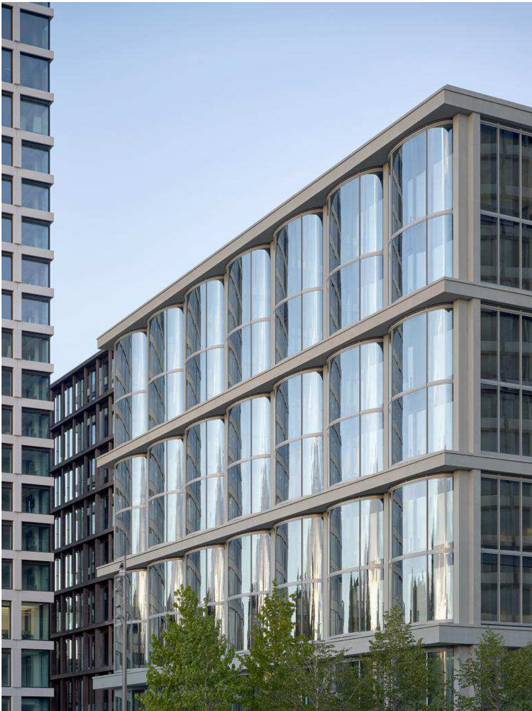
Roger Dieners Entwurf besitzt zum Baloise-Park hin gebogene Erkerfenster.